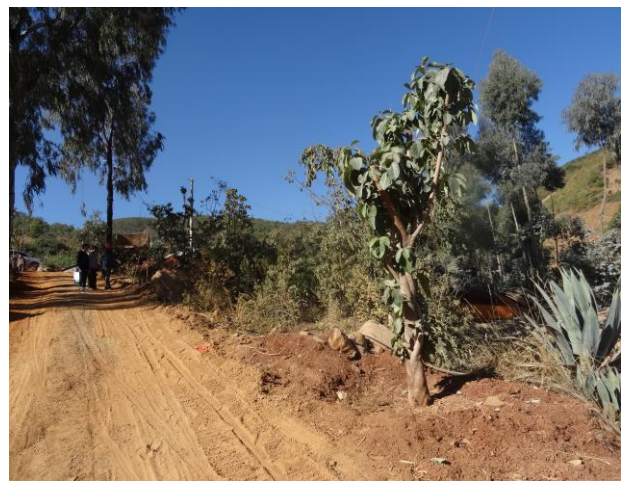
矿山开采区植被恢复