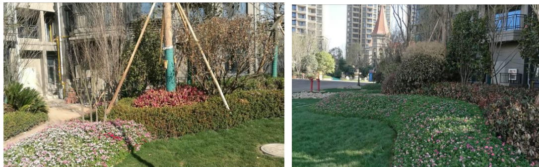
景观绿化区园林绿化情况

较、管理维护标准均较高，目前景观绿化区域植被已基本郁闭，能正常发挥其水土保持功能，区域水土流失主要为轻度的面蚀。