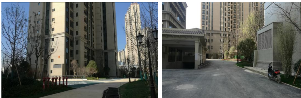
建构筑物区建筑物覆盖及排水设施

建构筑物区建筑物总共有 3 栋，其中 2 栋 33 层的高层住宅楼，1 栋 5 层商业楼，负 2 层的地下整体车库（其中-1 层为夹层非机动车车库）及其它配套设施等构成。目前该区域均已被建构筑物覆盖，区域已不存在裸露面，区域水土流失主要为微度的面蚀。