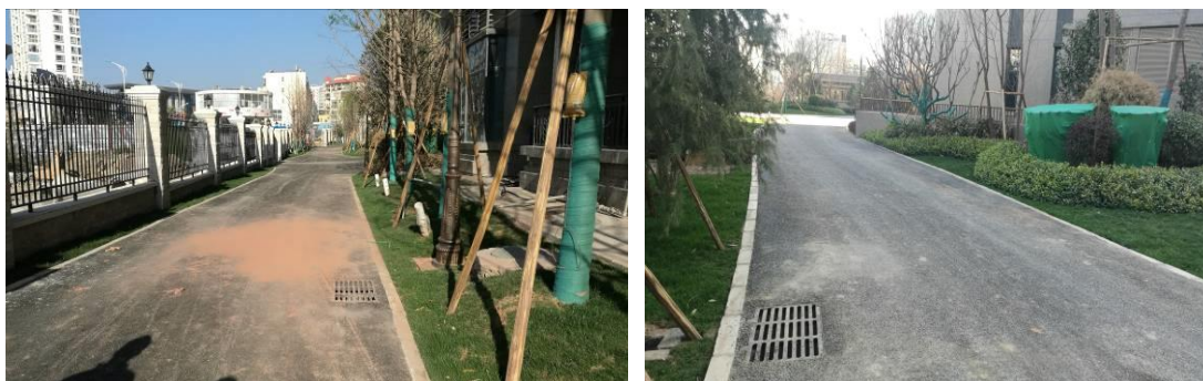
道路硬化及排水情况

项目建设各地块内道路及硬化场地区主要为连接各个建筑物之间的、主干道、休闲广场等占地，目前均采取了水泥硬化和透水措施，区域已不存在裸露面，区域水土流失主要为微度的面蚀。